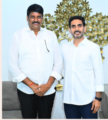
మిగతా 2 లో